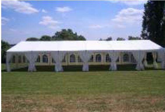
CHAPITEAU 50M2 /1000M2 TARIF SUR DEVIS