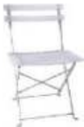
CHAISE SQUARE 5€TTC