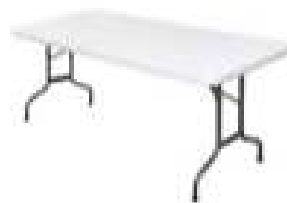
TABLE RECTANGULAIRE : 8 PERS (180CM) AVEC NAPPAGE BLANC 25€TTC