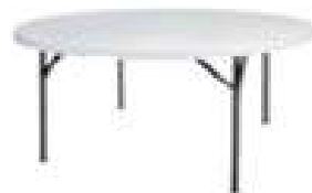
TABLE RONDE : 8 À 10 PERS (150CM) AVEC NAPPAGE BLANC 25€TTC