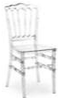
CHAISE CRISTAL 8€TTC