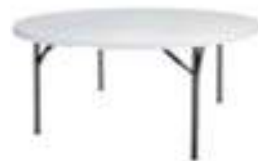
TABLE RONDE :10 À 12PERS (180CM) AVEC NAPPAGE BLANC 25€TTC