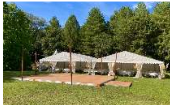
PARQUET /PISTE DE DANSE 50M2 /1000M2 TARIF SUR DEVIS