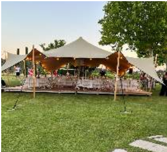
TENTE NOMADE 80M2/160M2/240M2/320M2 TARIF SUR DEVIS