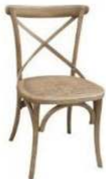
CHAISE BISTROT 8,50€TTC