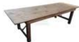
TABLE RECTANGULAIRE : 8 PERS (200CM) 85€TTC