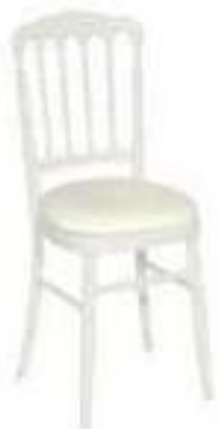
CHAISE NAPOLÉON BLANCHE 8€TTC